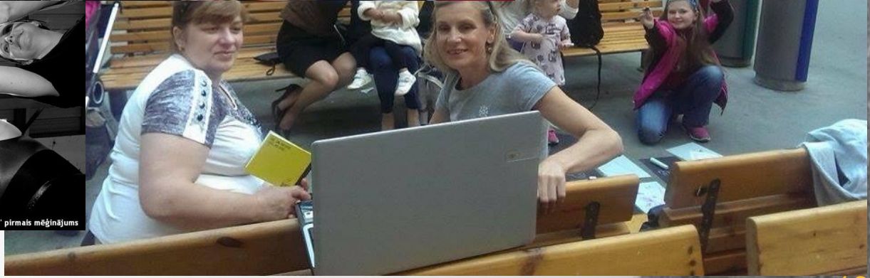
TDK "Pērkonkalns" pirmais mēģinājums